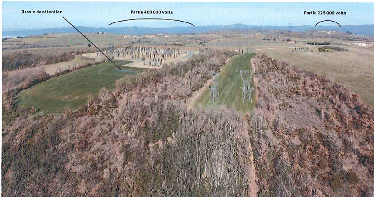
Photomontage du poste électrique Sud-Aveyron

225 000 volts est placé sous enveloppe métallique, ce qui, comme le dossier l'indique, permet de réduire la surface globale du projet, initialement de 10 ha, à 5 ha. D'autre part, le parti de RTE de construire le poste "en encaissement" dans le terrain naturel permet aussi de diminuer l'impact en termes de paysage. L'Ae constate que l'impact résiduel paysager de l'échelon 400 000 volts demeure, même si le projet a été conçu de façon à le limiter le plus possible vis-à-vis des lieux habités, d'autant que le dossier ne permet pas de comprendre quelles recherches ont été entreprises, même vaines, pour le réduire davantage.